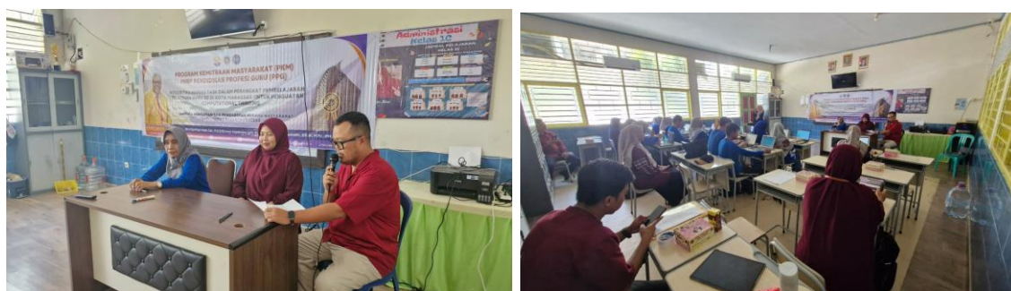
Gambar 3. Pelaksanaan Kegiatan

Pelaksanaan kegiatan pengabdian kepada masyarakat dimulai dengan sosialisasi program kepada sekolah mitra dan PGRI Kota Makassar. Pada tahap ini diperkenalkan tujuan, urgensi penguatan Computational Thinking (CT), serta gambaran alur dan luaran kegiatan. Mitra memberikan respon positif dan menyatakan komitmen untuk menyediakan fasilitas serta peserta guru yang mengikuti kegiatan secara penuh. Sosialisasi ini memastikan seluruh pemangku kepentingan memahami alur program sejak awal sehingga pelaksanaan kegiatan dapat berjalan terarah.