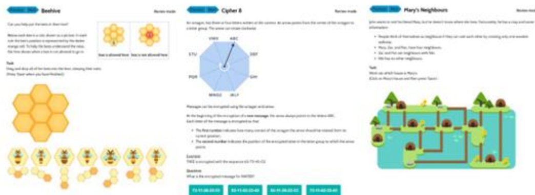
Gambar 2. Lembar Kerja Siswa Berbasis Bebras Task

dimanfaatkan sebagai bahan ajar, asesmen formatif, maupun media simulasi pembelajaran berbasis tantangan