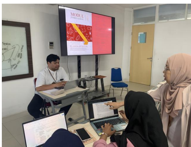
Gambar 5. Pendampingan dan Pengecekan Modul Ajar

Pada tahap pendampingan dan pengecekan modul ajar, peserta diberikan kesempatan untuk menunjukkan contoh modul ajar yang dimiliki untuk didiskusikan bersama narasumber. Kegiatan ini membantu peserta memahami kesesuaian struktur dan komponen modul ajar berdasarkan karakteristik Kurikulum Merdeka. Narasumber memberikan arahan terkait penyusunan tujuan pembelajaran, langkah kegiatan pembelajaran, serta asesmen yang relevan dengan capaian pembelajaran. Berdasarkan hasil observasi, peserta terlihat aktif memperhatikan masukan yang diberikan dan beberapa peserta mulai memahami kesalahan maupun kekurangan pada modul ajar yang dimiliki.