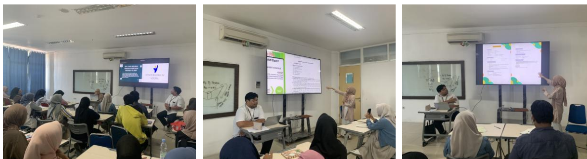
Gambar 4. Sosialisasi Materi Modul Ajar dan Kurikulum Merdeka

Pada tahap sosialisasi, peserta memperoleh pemahaman mengenai konsep dasar Kurikulum Merdeka dan struktur modul ajar sebagai perangkat pembelajaran. Materi yang disampaikan meliputi komponen modul ajar, tujuan pembelajaran, langkah kegiatan pembelajaran, serta asesmen pembelajaran. Penyampaian materi dilakukan secara interaktif sehingga peserta dapat memahami keterkaitan antara perangkat pembelajaran dengan implementasi Kurikulum Merdeka. Berdasarkan hasil observasi selama kegiatan berlangsung, peserta menunjukkan perhatian yang baik terhadap materi yang disampaikan, khususnya pada pembahasan terkait komponen modul ajar dan penyusunan tujuan pembelajaran.