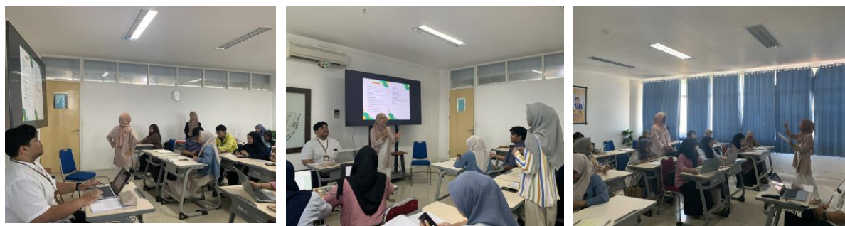
Gambar 6. Diskusi dan Tanya Jawab

Kegiatan pengabdian kemudian ditutup dengan sesi dokumentasi bersama antara narasumber dan peserta kegiatan. Dokumentasi ini menjadi bagian dari penutup rangkaian kegiatan edukasi penyusunan modul ajar dalam implementasi Kurikulum Merdeka bagi calon guru IPA. Suasana kegiatan yang berlangsung hangat dan interaktif menunjukkan antusiasme peserta selama mengikuti seluruh tahapan kegiatan pengabdian.