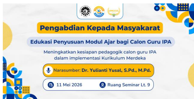
Gambar 2. Banner Kegiatan Pengabdian kepada Masyarakat