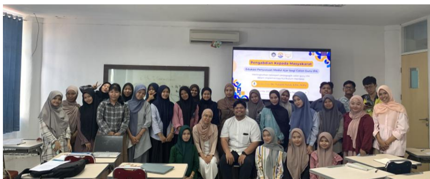
Gambar 7. Foto Bersama Narasumber dan Peserta Kegiatan

Kegiatan pengabdian kemudian ditutup dengan sesi dokumentasi bersama antara narasumber dan peserta kegiatan. Dokumentasi ini menjadi bagian dari penutup rangkaian kegiatan edukasi penyusunan modul ajar dalam implementasi Kurikulum Merdeka bagi calon guru IPA. Suasana kegiatan yang berlangsung hangat dan interaktif menunjukkan antusiasme peserta selama mengikuti seluruh tahapan kegiatan pengabdian.