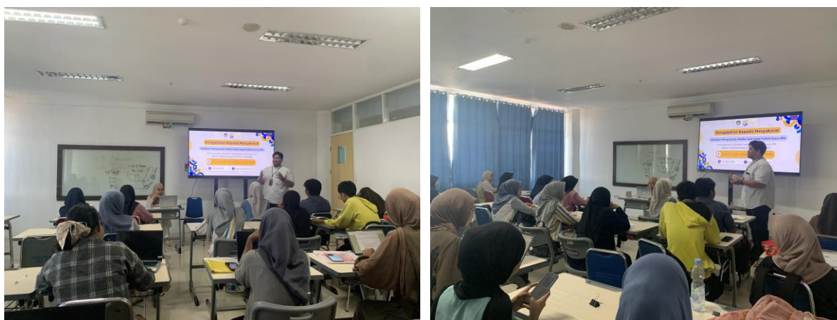
Gambar 3. Kegiatan Edukasi Penyusunan Modul Ajar

Pada tahap sosialisasi, peserta memperoleh pemahaman mengenai konsep dasar Kurikulum Merdeka dan struktur modul ajar sebagai perangkat pembelajaran. Materi yang disampaikan meliputi komponen modul ajar, tujuan pembelajaran, langkah kegiatan pembelajaran, serta asesmen pembelajaran. Penyampaian materi dilakukan secara interaktif sehingga peserta dapat memahami keterkaitan antara perangkat pembelajaran dengan implementasi Kurikulum Merdeka. Berdasarkan hasil observasi selama kegiatan berlangsung, peserta menunjukkan perhatian yang baik terhadap materi yang disampaikan, khususnya pada pembahasan terkait komponen modul ajar dan penyusunan tujuan pembelajaran.