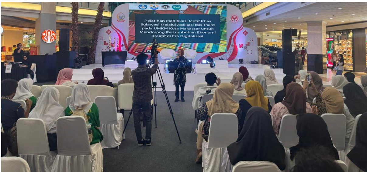
Gambar 1. Pembukaan Kegiatan Pelatihan

Pelaksanaan pelatihan modifikasi motif khas Sulawesi melalui aplikasi Ibis Paint di Kota Makassar memperoleh respons positif dari para peserta UMKM. Antusiasme peserta terlihat sejak awal kegiatan, dan mereka sangat terlibat dalam diskusi tentang cara mengembangkan desain berbasis budaya lokal dan peluang pemanfaatannya dalam ekonomi kreatif. Sebagian besar peserta mengakui bahwa sebelum kegiatan berlangsung, mereka masih mengandalkan desain manual atau menggunakan pola motif yang tersedia secara umum tanpa melakukan pengembangan visual secara mandiri.