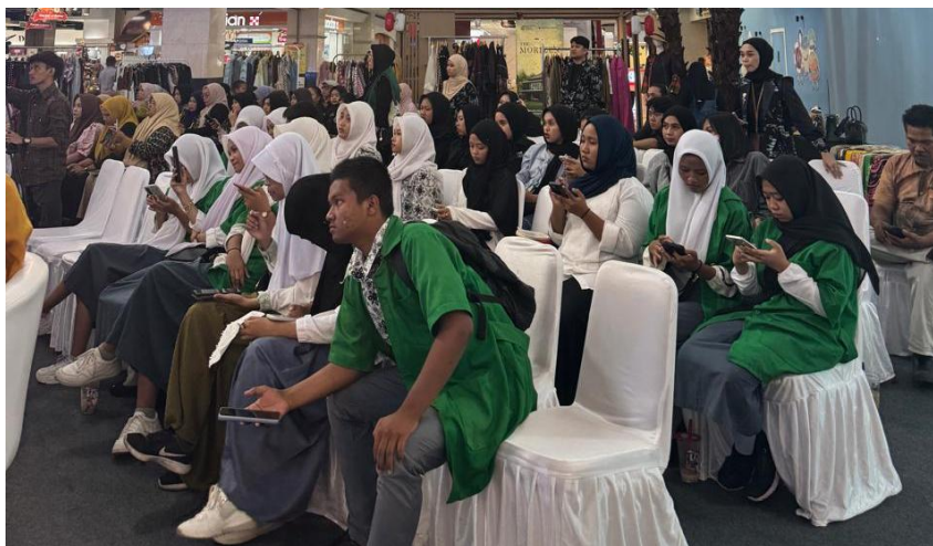
Gambar 3. Peserta Memperhatikan Materi

Produk desain yang dihasilkan dapat dikelompokkan menjadi tiga bentuk utama. Pertama, desain yang mengadaptasi motif Bugis–Makassar Lipa Sabbe dan pola geometris dengan modifikasi warna yang lebih modern dan fleksibel untuk diaplikasikan pada produk fesyen maupun media promosi digital. Kedua, desain berbasis motif Toraja yang menonjolkan unsur simbolik dan ornamentasi khas dengan penyesuaian bentuk agar lebih sederhana serta mudah diterapkan pada produk UMKM. Ketiga, desain kombinasi motif khas Sulawesi Selatan yang memadukan elemen Bugis–Makassar dan Toraja menjadi visual baru yang tetap mempertahankan identitas budaya namun memiliki nuansa kontemporer.