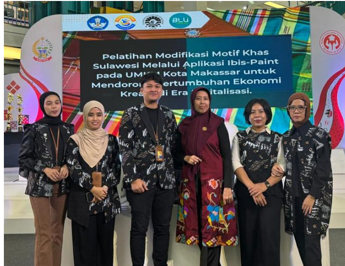
Gambar 5. Foto Bersama Setelah Kegiatan Pengabdian

Pelatihan ini secara keseluruhan menunjukkan bahwa integrasi antara budaya lokal, teknologi digital, dan kreativitas pelaku UMKM memiliki potensi besar untuk menghasilkan inovasi produk yang bernilai ekonomi. Pengembangan motif khas Sulawesi melalui media digital bukan hanya upaya pelestarian budaya, tetapi juga strategi pemberdayaan masyarakat dan penguatan daya saing UMKM di tengah perkembangan ekonomi digital.