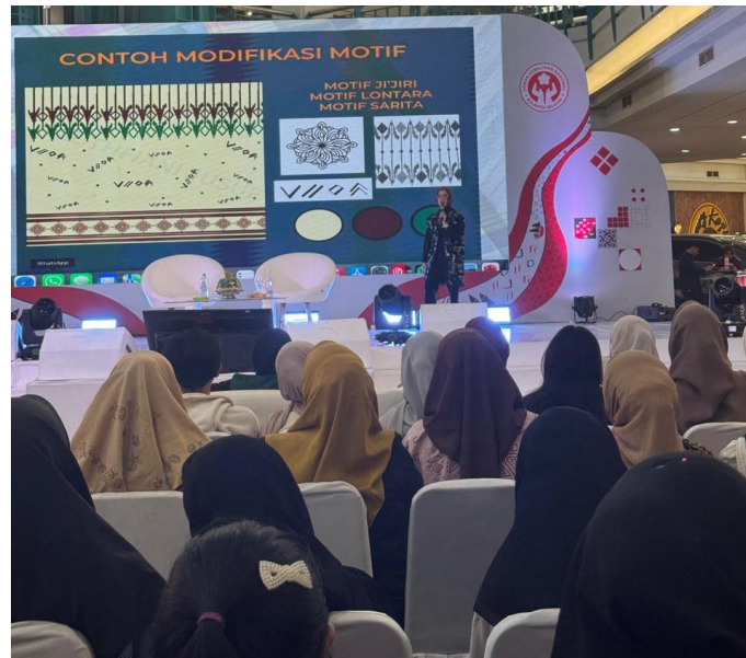
Gambar 2. Penyampaian Materi Modifikasi Motif

Hasil observasi menunjukkan bahwa peserta belajar keterampilan secara bertahap selama sesi praktik. Pada awal pelatihan, beberapa peserta masih mengalami kesulitan dalam mengatur garis, menggabungkan warna, dan menyusun komposisi motif. Namun, dengan bimbingan yang intensif, peserta mulai mampu melakukan eksplorasi visual dan membuat desain yang lebih kompleks dengan karakter lokal yang kuat.