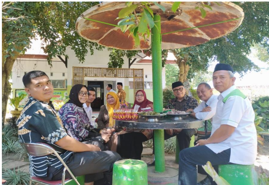
Gambar 1. Duduk santai di Taman MAN Gowa (antara dosen Prodi SPI dengan Kepsek MAN Gowa) membincang prospek kerjasama kedepannya.