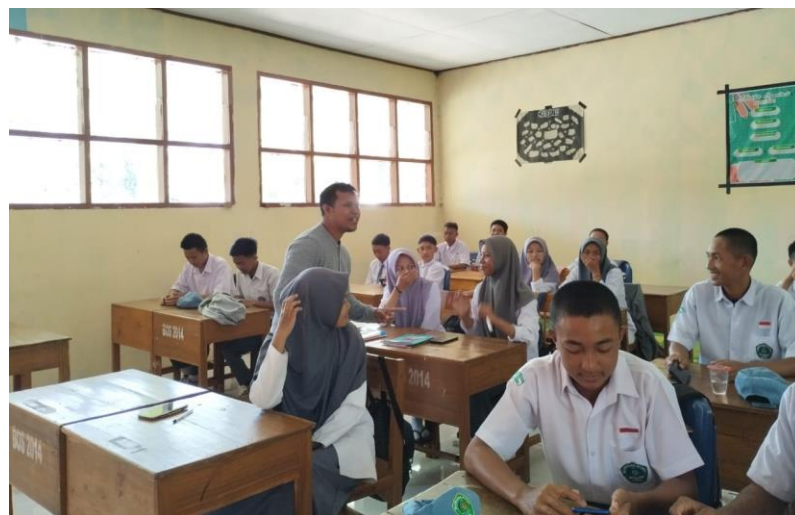
Gambar 4. Pemaparan Materi Seputar Media Sosial dalam Bingkai Kebudayaan

Materi disampaikan secara langsung oleh tim pengabdian di ruangan yang berbeda dengan materi yang berbeda pula. Materinya secara umum tentang “Pembekalan Siswa-Siswi dalam Mengaktualisasikan Nilai-Nilai Seajrah dan Budaya Islam dalam Kehidupan Akademik di Sekolah dan dalam Kehidupan Sehari-hari”. Dari materi ini dikerucutkan salah satunya tentang penggunaan media sosial dalam bingkai kebudayaan Makassar yang diberi judul “Media Sosial untuk Budaya: Mendorong Generasi Milenial (Siswa Siswi MAN Gowa) untuk Menghargai Nilai-Nilai Tradisional Masyarakat Makassar” Pemaparan materi memancing peserta bertanya seputar media sosial dalam penggunaan dan tantangannya. Cara ini penting untuk menggali pengetahuan siswa- siswi dalam bermedsos. Setelah itu, pemateri memaparkan materinya.