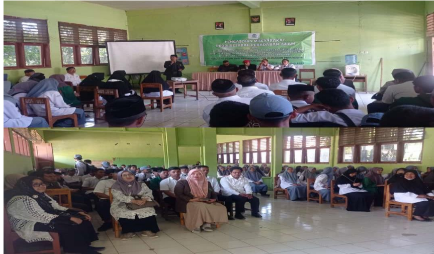
Gambar 3. Pembukaan Acara PKM Secara Resmi di Aula MAN Gowa

resmi. Sesi pembukaan kegiatan dihadiri oleh sejumlah dosen dari prodi SKI FAH UIN Alauddin Makassar dan siswa-siswi MAN Gowa yang dibuka secara resmi oleh Kepala Sekolah MAN Gowa.