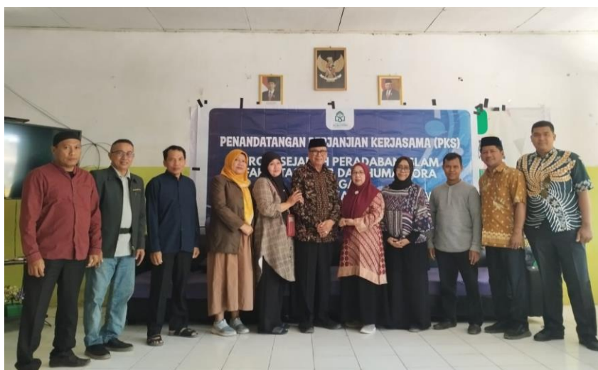
Gambar 5. Foto Bersama Usai Penutupan Secara Resmi

Setelah penyampaian materi dan demonstrasi kepada para peserta workshop, tahap terakhir dari kegiatan hari ini adalah sesi penutupan dan evaluasi kegiatan. Kegiatan ini diakhiri dengan foto bersama dan penandatanganan kerjasama antara MAN Gowa dengan Prodi Sejarah Peradaban Islam FAH UIN Alauddin Makassar kepada tim pengabdian oleh Kepala Sekolah.