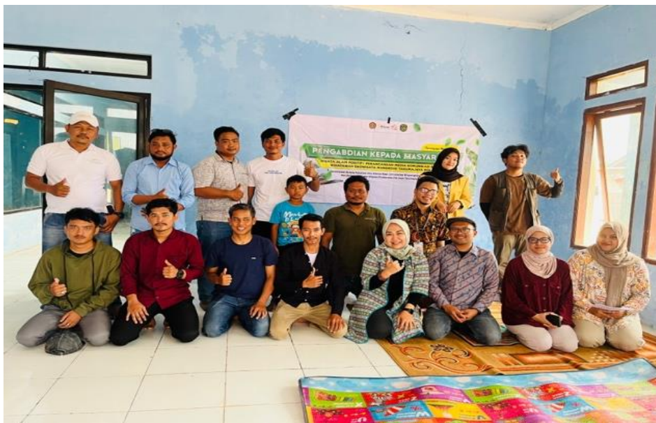
Gambar 4. Foto bersama tim abdimas dan Pokdarwis Pal Jaya

Selain mengenai gambaran wisata alam positif juga turut diberikan penyuluhan mengenai pesan informatif dan persuasif yang dapat mengedukasi wisatawan bahkan memberikan kesan yang bisa di implementasikan kedalam konten di media sosial maupun tradisional. Tidak hanya berupa ajakan saja, namun juga dikemas dalam bentuk storytelling yang memberikan kesan dan pesan moral sehingga wisatawan tidak hanya mengetahui saja, namun punya makna yang membekas disetiap perjalanannya. Sehingga jejak perjalanannya pun juga punya andil dengan positif untuk keberlanjutan hutan mangrove kedepannya.