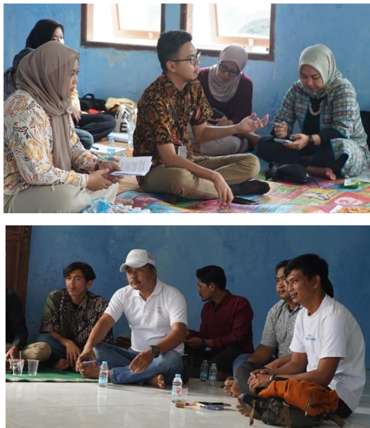
Gambar 3. Pemateri sekaligus tim abdimas memberikan penyuluhan

Tahapan berikutnya adalah menghadirkan beberapa narasumber dari dosen Fikom Ubhara Jaya untuk turut memberikan arahan dan gambaran mengenai tema terkait. Gambaran mengenai wisata alam positif itu sendiri serta pesan-pesan informatif dan persuasif yang bisa dijadikan senjata dengan mata dua sisi, sisi pertama sebagai edukasi wisatawan dan sisi kedua sebagai daya tarik jika terimplementasi dengan baik, jika kawasan ekowisata mangrove Tarumajaya tetap terjaga kelestariannya dan memberikan efek berkelanjutan bagi semua elemen pendukungnya.