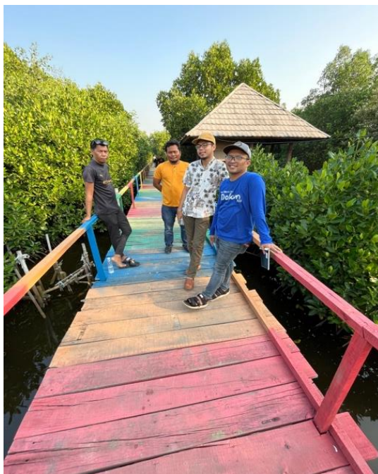
Gambar 2. Tim abdimas mensurvey kawasan ekowisata mangrove Tarumajaya

Tim pengabdian dari FIKOM Ubhara Jaya disambut baik untuk turut dihantarkan keliling menuju jembatan cinta sebagai ikon serta kawasan mangrove disekitarnya. Jembatan cinta yang menjadi ikon dan viral dengan ramainya kunjungan wisatawan sebelum pandemic COVID-19 menyerang ini punya ciri khas bukan bentuknya yang seolah menyerupai simbol cinta namun ketika menaiki jembatan tersebut bisa terlihat hampir seluruh kawasan ekowisata mangrove Tarumajaya ini, sehingga ini bisa menjadi daya tarik tersendiri untuk diabadikan bagi pengunjung dengan latar hutan mangrove tersebut.